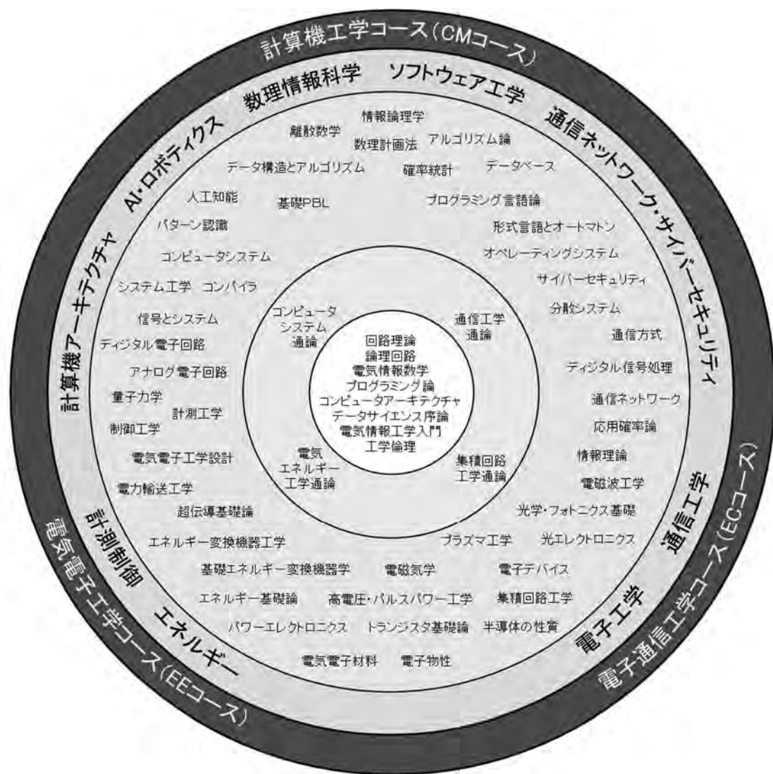
図1 電気情報工学の分野の拡がり